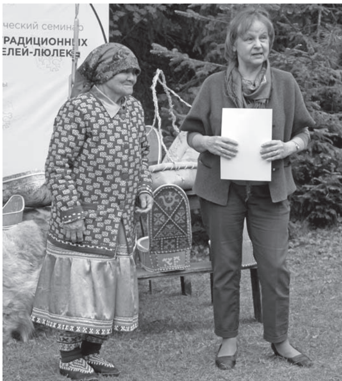
Ма́щтыр Э́ква Н.Н. Фе́дорова, уче́ный нэ́, э́т по́слым ӧлы