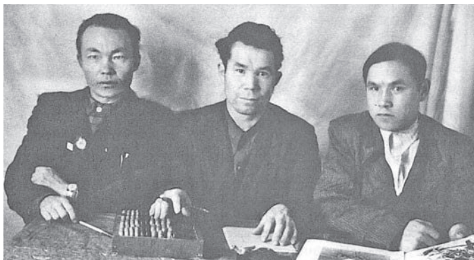
Ёмас палныл Немдазин Н.И. үнлы

Ты тал яныг хонт нак оигпам пасныл 75 тал товлыс. Ты кастыл ман касың газетат Хальүс район мань павылтныл хонтлын накын ялум маньши хотпанув урыл хансэв. Ты потрыт «Птицы светлой памяти» нампa нэпакт хансым олэгыт.