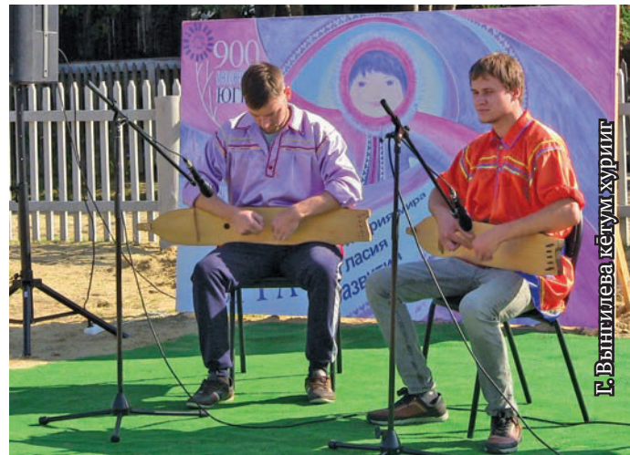
Г. Вынгилева кетум хуриит

Сұқыр этпос сатыт хөталэт Хальүс район Ягрим павылт өлнэ махум хөтал палыт мүйлысыт. Ягрим 1964 тал пәсыл павлыг ловиньтаңкве патвес, ос ань тав 55 тәлэ янытлавес.