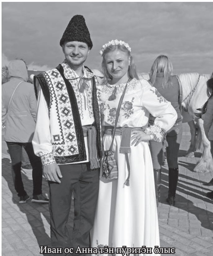
Иван ос Анна тән пүритән олыс

Тувьт хоталыят юипалт молдавский пўри олыс. Маҳум тот емас номтыл муйлысыт. Яныг концерт варыглавес, савсыр ансамблит эргысыт, ййквсыт. Этипалаг касың организация янытлавес, диплом-нэ-пакыл майвес.