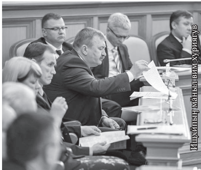
Ищхипың маңыл вим хуригүв