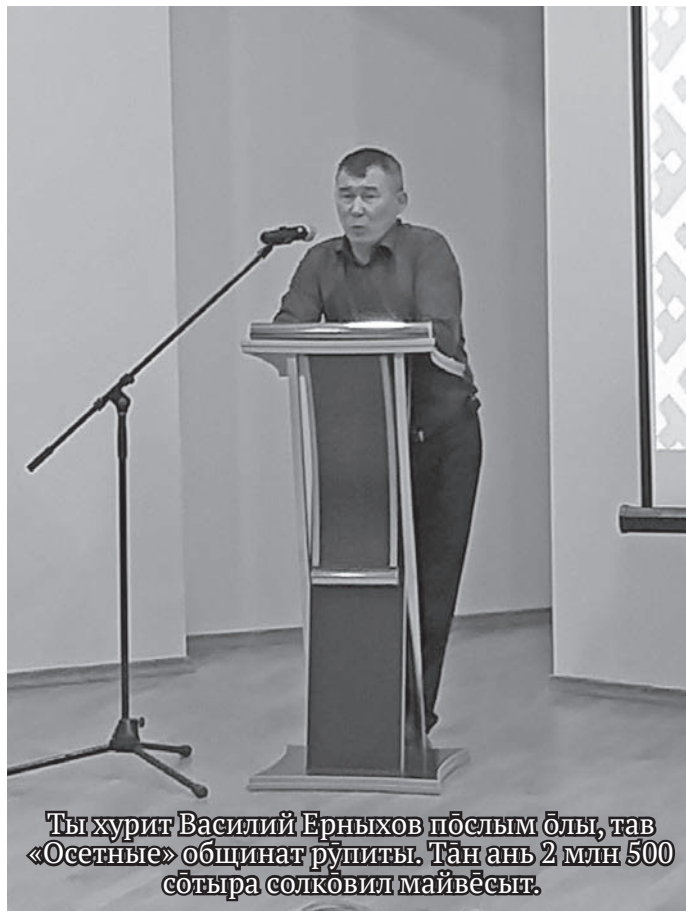
Ты хурит Василий Ерныхов пoслым oлы, тaв «Осетные» oбщинат рљпиты. Тaн aнѣ 2 млн 500 солкoвa рљпитaн мaйвѣсыт.

Сaлы ѣвтнэ ос тaнaныл янмaлтан мaгыс Белоярский районныл ѣхтaлaм «Осетные» oбщина 2 млн 500 солкoвил нѣтавет. Вoраян тѣлат ѣлаль тотнэ мaгыс «Охлым» oбщина нoх-пaтыс. Ты oбщина Ханты-