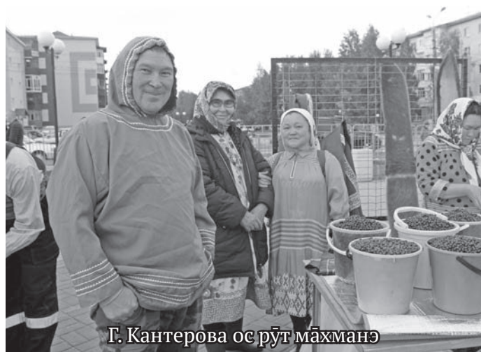
Г. Кантерова ос рӯт маҳманэ

Уфа ўст ам искуства училище а́стласум, гармошкaл ёнгункве хаништахтасум. Ань Пойковский ўст национальный культура центр тармыл кўщаит олэгум. Тот коллектив оныщев, эргев. Ам амти эргытварегум, эргеум».