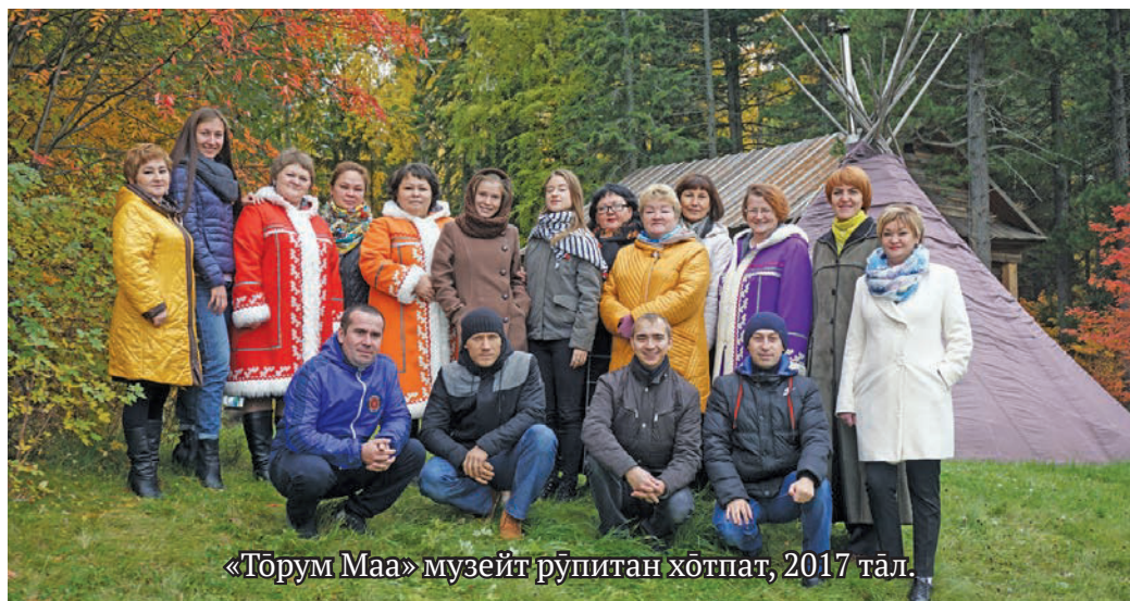
«Төрүм Маа» музейт рўпитан хōтпат, 2017 тѣл.