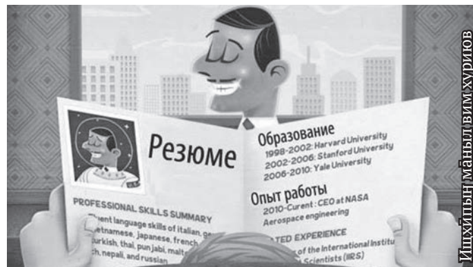
Ишхипың маңыл вимхуриов

ишхипың утыл рүпитанкве хасэгын манос мот хон махум латың вагын, машинал яласан нэпак, ёрың, ёньщегын, пуссын тув хултуңкве рови.