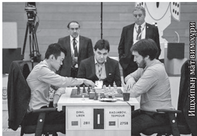
Ищхипың ма́т вим хури

Ань нөх-патум хум 110 сөтыра доллар олныл миве (рубль олныл лови-ньтаңкве те – ты 7 миллион 150 сөтыра савит солкөви). Теймур Раджабов тох лавыс: «Касыл щёпитама ма́хум тәланыл мусхал щирыл вәрсаныл, тананылн пумащипа