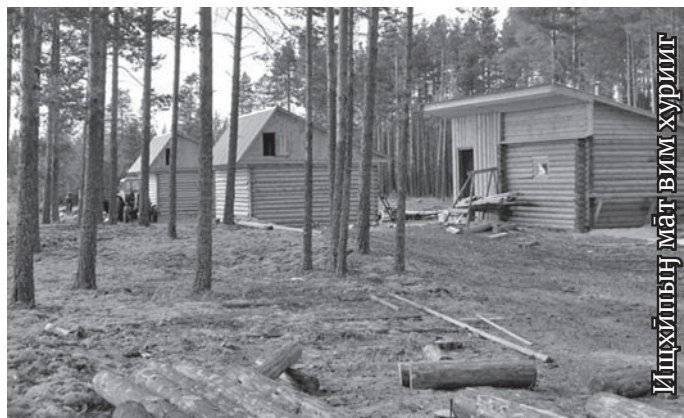
Ищхыпң мат вим хуриг

пувиянув. Ман ты рупата элал воруңкве тах патылүв.