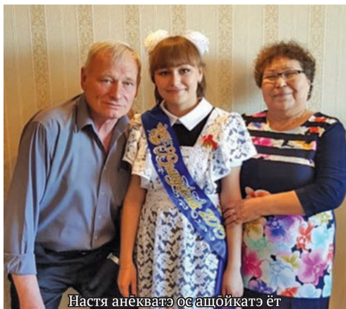
Настя анёкватэ ос ащойкатэ ёт

Ман Анастасия Алек- сандровна ханищтан хотпат ялпың хоталыл янытлылүв, олупсатэ посыңыг вос олы, ном- танэ тэлаг вос ёмтэгыт, пус кат, пус лагыл.