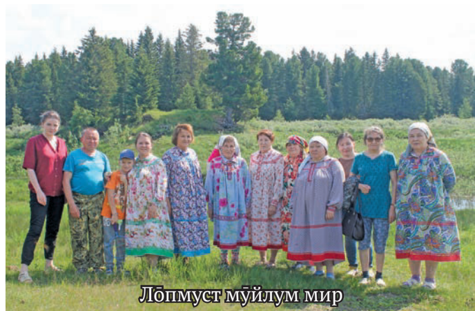
Лопмуст мүйлүм мир