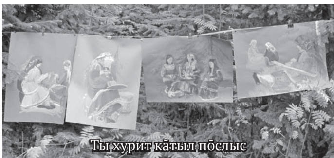
Ты хурит катыл пōслыс