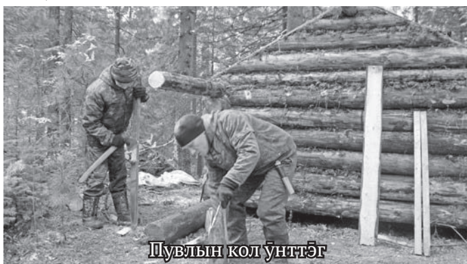
Пувлын кол үнттэг