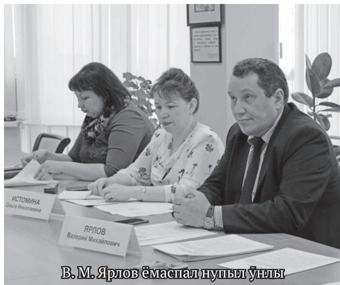
В. М. Ярлов ёмаспал нупыт ұныл

Перепись тэла хосыт пуссын тэра-паты – Россият манах хотпа олы, манхурип образо- вание оныщэгыт, щань латңаныл ваганыл ман ати, ювле хулытум лов тал сыс манхурип йи- льпи вэрмалит квэлта- паптувэсыт, маныр ос воссыг ат эри, ёрувляңкве патвес, тувыл манах хотпа нусаг олы манос щёлың, мот мань вэнтлум хотпат, рупитан ос ха- нищтахтын, пенсият олнэ махум. Пуссын ты овылтыт мань перепись тэла оигпан порат ваңкве тах патэв.