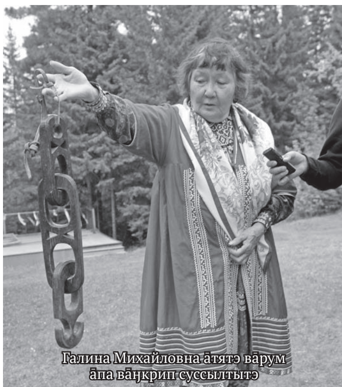
Галина Михайловна атятэ вэрум апа ванкрип суссылтытэ