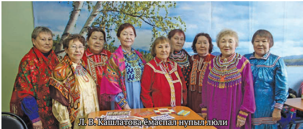
Л. В. Кашлатова ёмаспал нупыл лүли