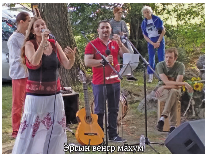
Ӑргын венгр махум