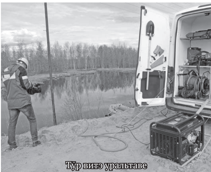
Тур витэ уральтаве