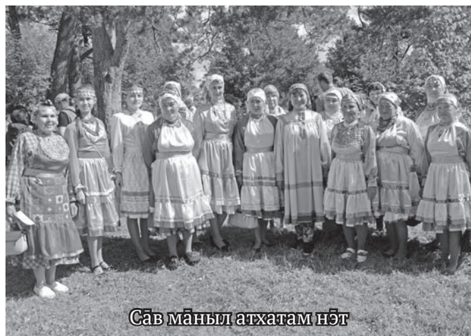
Сѓв маңыл атхатам нѓт