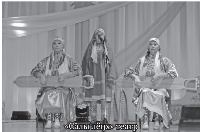
«Салы лёңх» театр

Овыл хоталэт яныг сапрәни олыс, кұщайт тув ос ёхталасыт. Магомедсалам Магомедов, Россия Президент палт рүпитан хум, Владимир