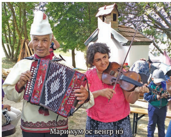
Мари хум ос венгр нӧ