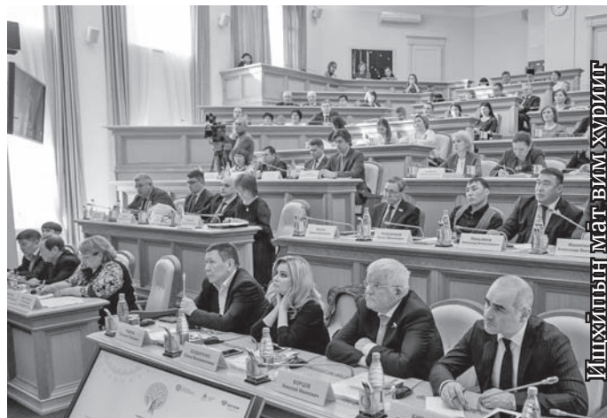
Ишхилың маг-вим хуриг

Россият олнэ мирыт паспорт-нэпаканылт национальность ат хансавет,