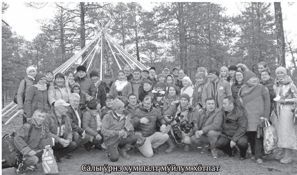
Салы үрнэ хум палт мүйлум хотпат

Мүйлын порав хосаг ат олыс, посың торыг ювле минуңке эрыс. Тот сака ёмас мүйлысүв, махум ёмшакв танки халанылт вайхатасыт, румалахтасыт ос щәгтым ювле та минасыт.