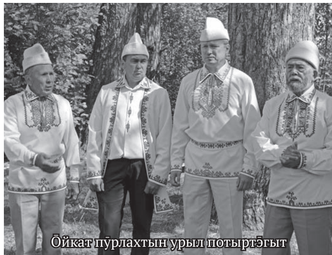
Ѓйкат пурлахтын урыл потыртѓгыт

Сѓв вѓрмалянув аквхурипаг ѓлѓгыт, наскѓссыг хунь маң финно-угрыт рѓтыг ѓлнѓ мирыг лѓвиньтахтѓв, пѓс йис тѓ-