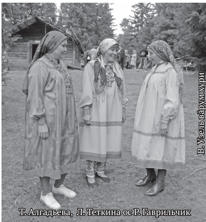
В. Уэль вэрм хури

Нэпак ты тал оигпан мус тах пирмайтаве, ты юи-палт Россият олнэ сосса мирыт пуссын тув хансуңкве овылтавет. Саккон щирыл махум