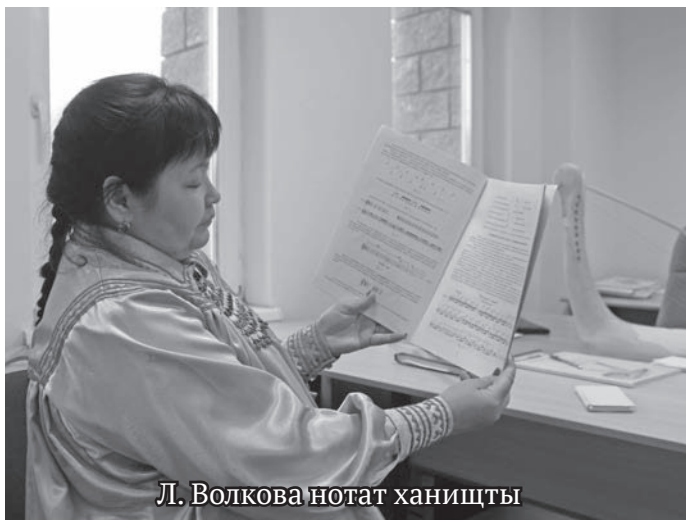
Л. Волкова нотат ханищты