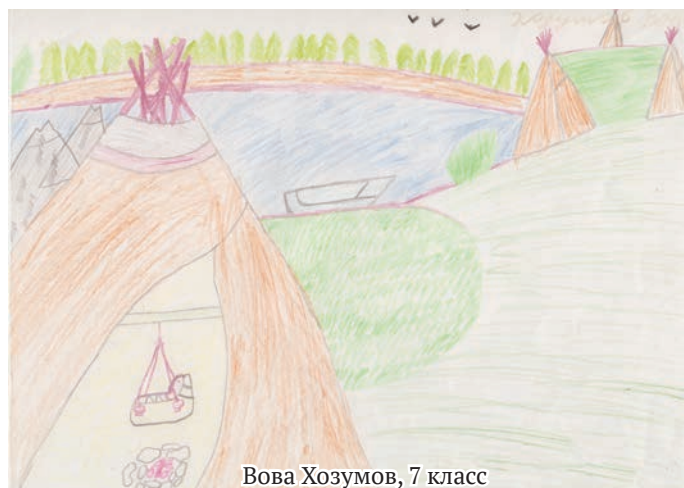
Вова Хозумов, 7 класс

Луима сэрипос (Северная зоря) №15 (1081), 08.08.2014