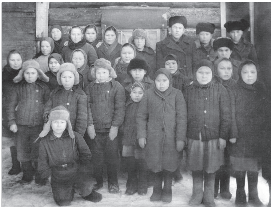
Школа-интернатт ханищтахтам ныврамыт, Проточные пәвил, 1951 тәл.