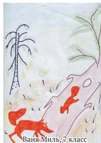
Ваня Миль, 7 класс