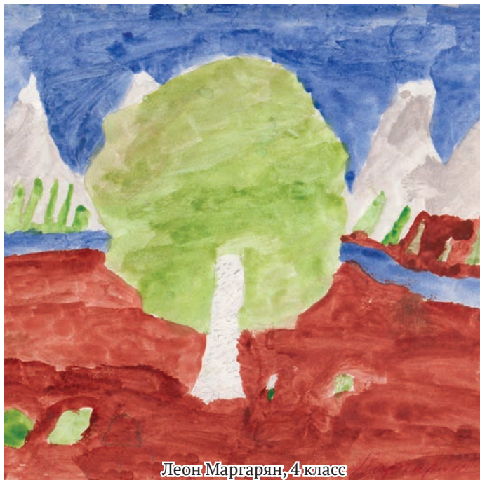
Леон Маргарян, 4 класс