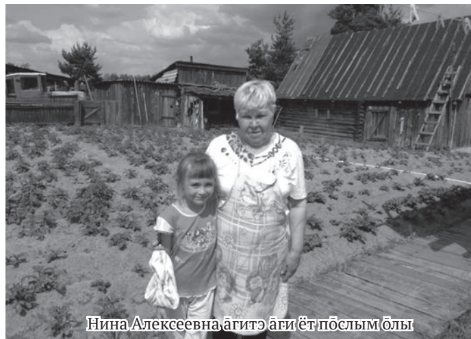
Нина Алексеевна агитэ аги ёт пәслым ылы

Нина Алексеевна яныг щәмьят яныгмас, щәняге-ащәге онтолов ныврам янмалтасыг. Щәмьянылт тав шар мәниг ылыс. Оматэ Ефросинья Дмитриевна Карым павылныл ылыс, тот интернатыйт ныврам үргалан нэг сав тәл рүпитас. Аятэ Алексей Семёнович Чадов, Свердловский областил ёхтум руш хум.