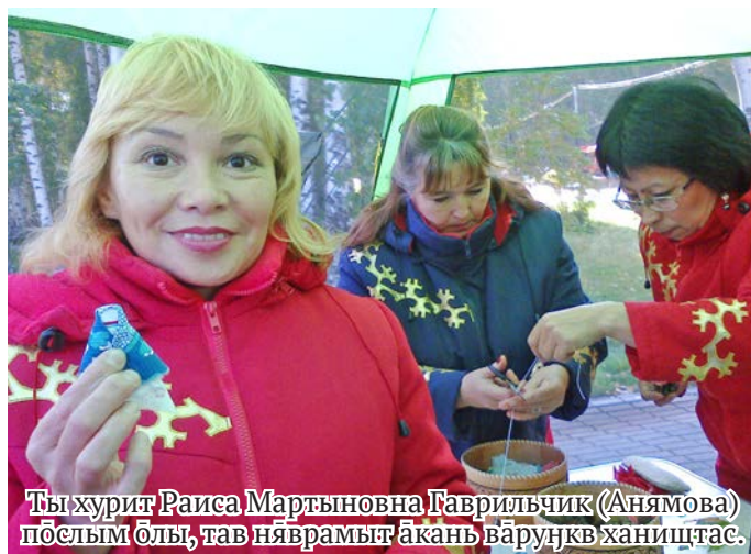
Ты хурит Раиса Мартыновна Гаврильчик (Анямова) посылым олы, тав няврамыт акань воруңкв хаништас.