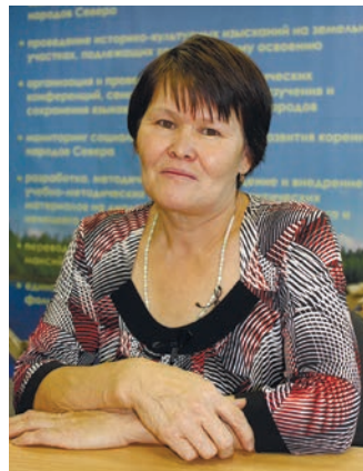
Света Динисламова палт олэгыт.

Сургут үсн хунь ёхтысүв, тāра УФСн минасүв, тот пуссын эрнэ нэпакыл вāрвесүв. Страховой полисыл пуссын молях майвесүв, пүльницан лēккарыт палт уральтахтүңкве кётвесүв. Виталя пыгум хōпсытэ пōслувес, тувыл пүльницан пинвес. Тав 2011 тāлт хōпсытэ āгмыңыг ёмтыс, тōнт пүльницатсака хоса пусмалтавес. Лēккарытн тōнт лāvвес, пүльницан уральтахтүңкве вāтихал вос ёхталы. Сургут үст хōпсытэ пōслувес, лēккарыт тот матыр оста кāсаласыт. Пыгум мāгсыл ань таком сымум āгмың. Ань Виталям Сургут үс пүльницат пусмалтахты, нāвраманум Ханты-Мансийск үст