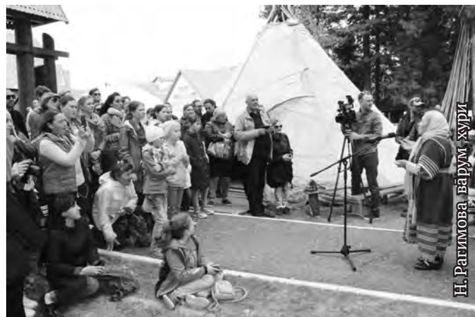
Н.Раимова вāрум хури

Юи-ōвыл хōталт нōхпатум хōтпат янытлавэсыт. Тув округ