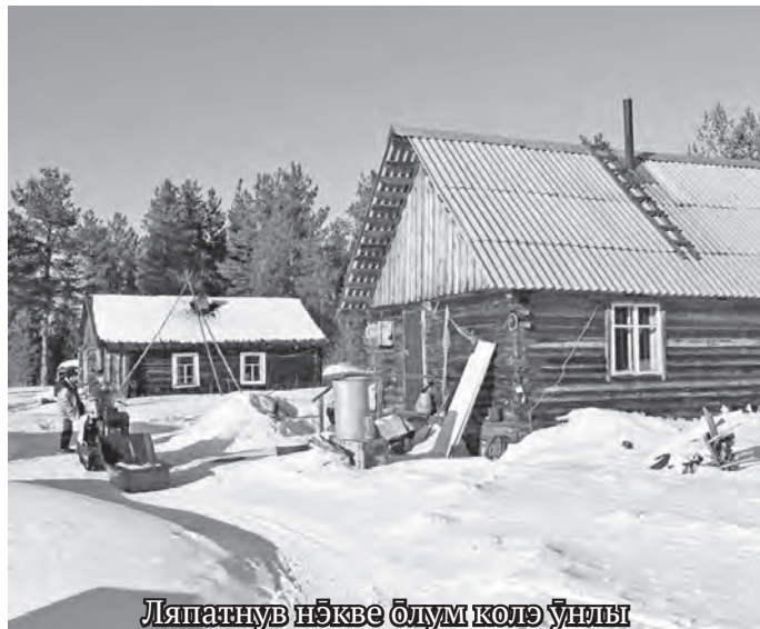
Ляпатнув нёкве блум колё ўны

виньтын ёхтувес, аквёет маткем та мовиньтасуь.