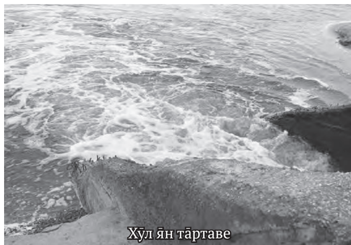
Хул ян тартаве