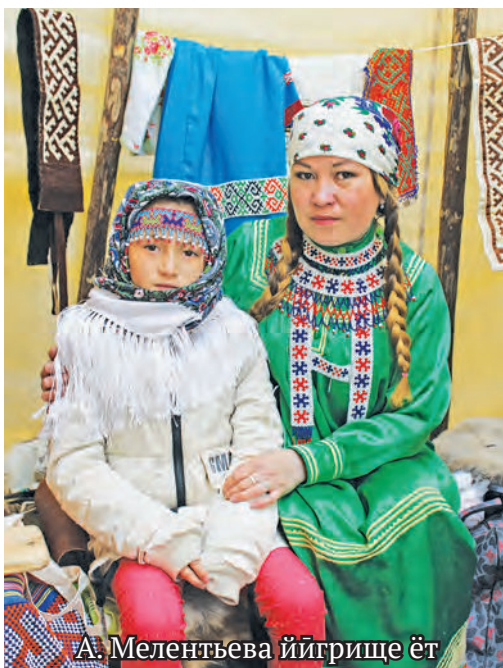
А. Мелентьева ййгрище ёт