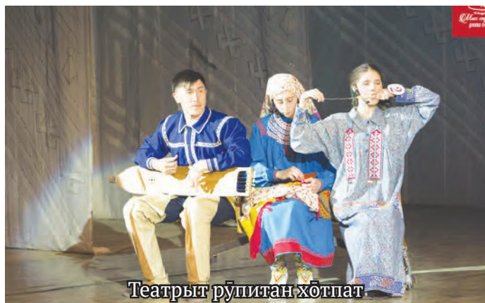
Театрыт рүпитан хӧтпат