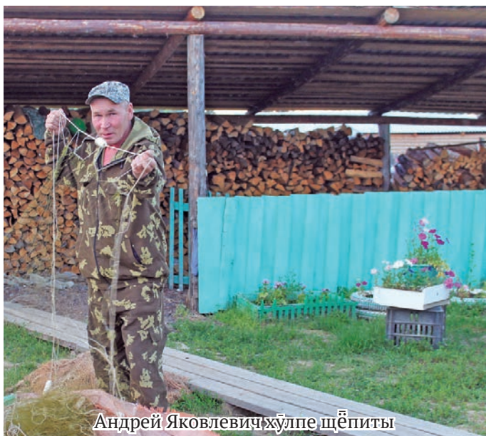
Андрей Яковлевич хулпе щёпиты

Ань потрумён та оигпас. Ты ятил мәнъщи нэквен ам пұмашипа латың лавэгум. Тамле эрнэ рупата вәруңке ёр вос оныщи, щёл вос оныщи. Колтаглэтыл пустагыл вос олы, Няянэн-Отыранэн вос үргалаве!