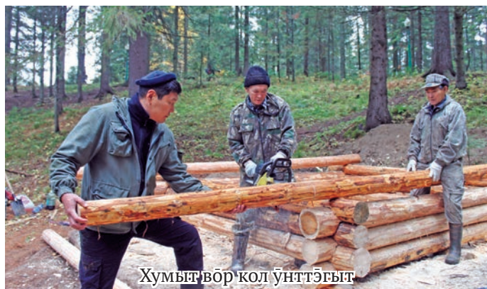
Хумыт вөр кол ўнттёгыт