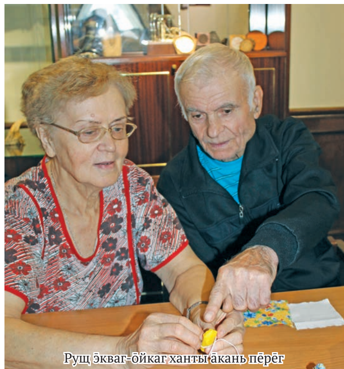
Руц экваг-ойкаг ханты акань пёрег

урыл нэматыр торың ат вагыт. Та титыглахтэгыт, манрыг аканит тох вәравет, вильт манрыг ат օныщёгыт, саманыл манрыг ат пöславет. Ос та соссаң мир օлупса урыл потыртавет.