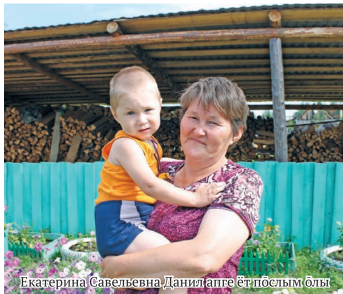
Екатерина Савельевна Данил аңге ёт пөслым олы

– Ам мәнъполь этпос 24 хоталёт 1968 талт