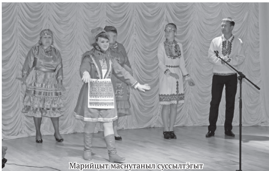
Марийцыт маснутаныл суссылтэгыт