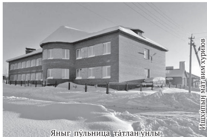
Яныг пұльница татлан ұнлы

Туи порат Хальүс райоң янытыл лёккарыт «Николай Пирогов» нампә найңхәпыл яласёгыт, касың павылыл пұхталэгыт ос тот олнэ мир уральтэгыт. Мән палтув ты найңхәп ат ёхталы,