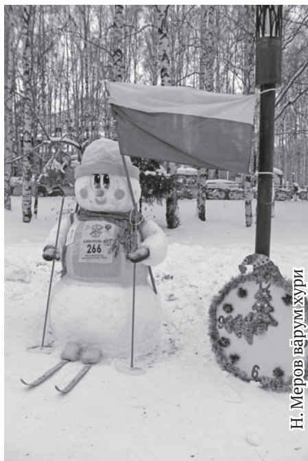
Н. Меро́в ва́румхури

Йильпи 2019 тал ёт нанан сымыңыщ янытлыяну!