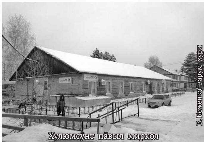
В.Боженко - варум хури