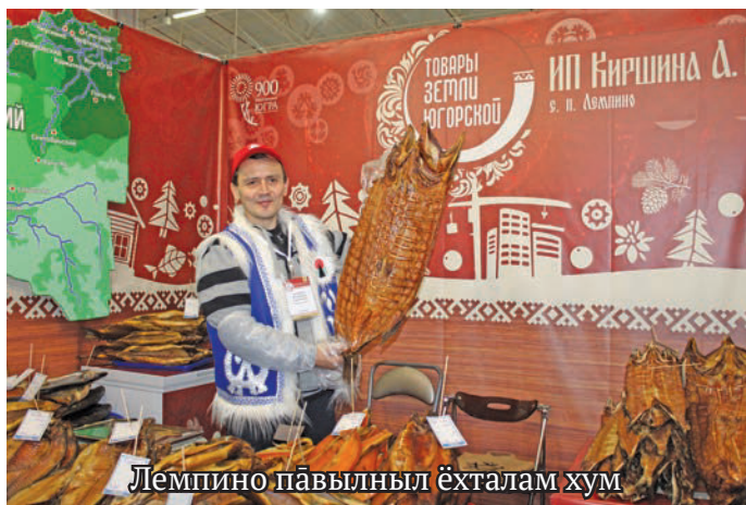
Лемпино павылныл ёхталам хум