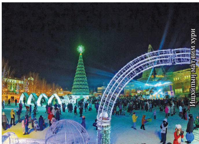
Ишхипы магым хури

В āt сәграпнал этпос сатыт хөталәт Ханты-Мансийск үс котилыт йильпи тәл әхтын кастыл савсыр мәныл Ащирма ойкат Снегурочканыл эт акван-атхатыгласыт. Ты тәл мак яныг Ащирма ойка Великий Устюг үсныл китхуйпловит щёс тыг әхталас.