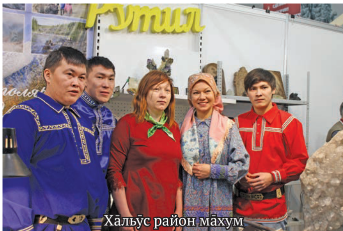
Хальүс район махум

Сәв тәл сыс «Си-бирская рыба» наппа хұл щәпитан завод тәнки вәрүм хұлың тәнүтаныл тыг тотыгласыт. Тән нялк, солвалың хұл, консерва пәнкат ос мот тәнүт суссылтап тыналасыт. Үи-овыл тәлыт хұл щәпитан завод мұс-