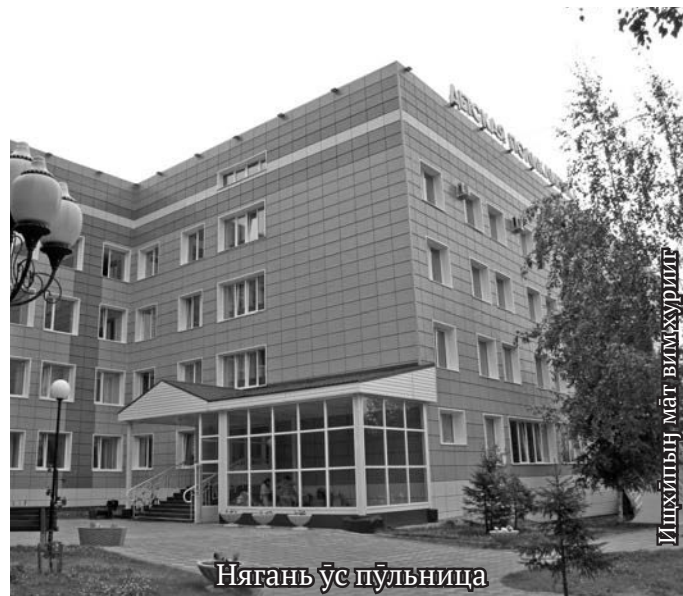
Нягань ұс пұльница

Тот рұпитан лёккарыт ос пусмалтахтын махум хохса хартункве ат тәртавет. Хохса хартнэ паттат ос сәвсыр тәрвит агмыл ёмтэгыт, ты урыл мирн акваг