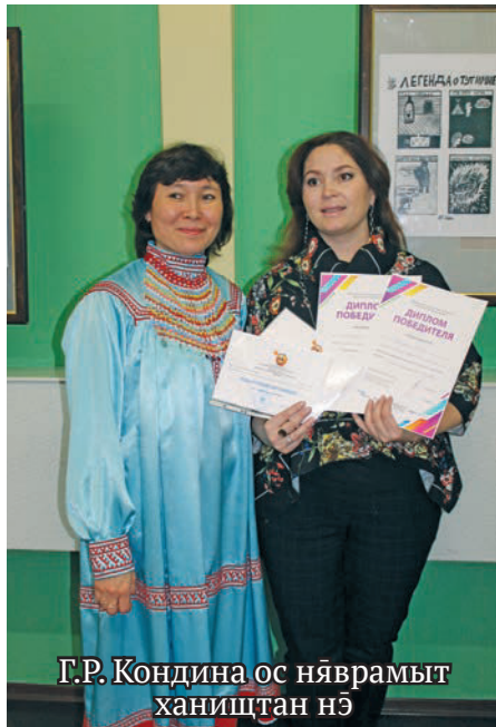
Г.Р. Кондина ос няврамыт ханищтан нэ