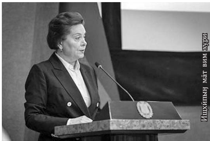
Ишхйпын мәт вим журн