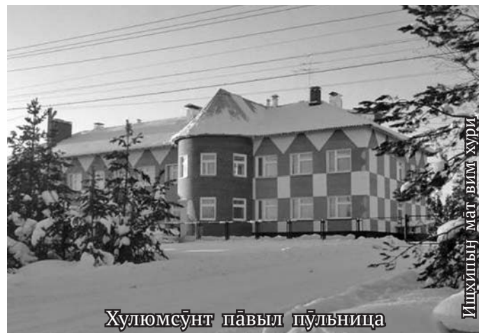
Ищхипың мāt вилм хури