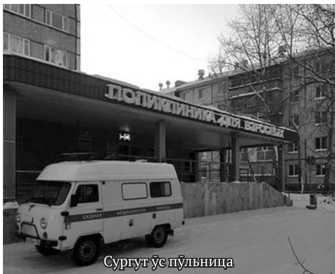
Сургут ұс пұльница

Ты потырт мәнәщи ләтңыл Николай МЕРОВ хассанэ.