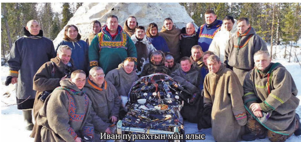
Иван пўрлахтын мån ялыс

— Ам яныг ўсытныл ёвтнэ мåхум ёт потыр-тахтэгум, тån ам ётум ойтхатэгыт, ам та ол-