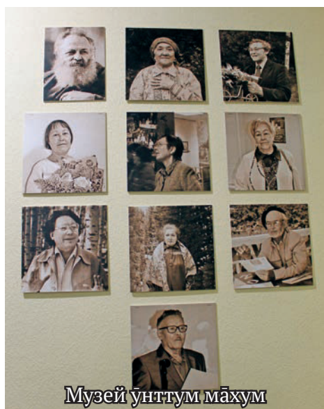
Музей унттум махум