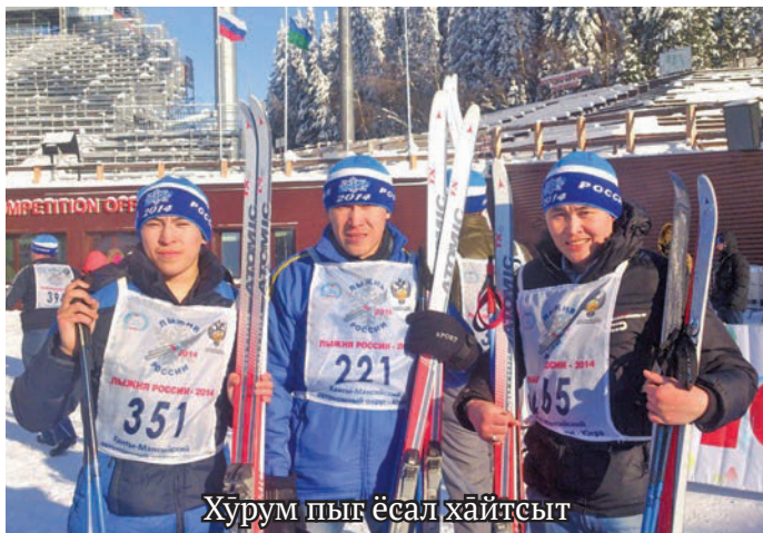
Хурум пыг ёсал хайтсыт