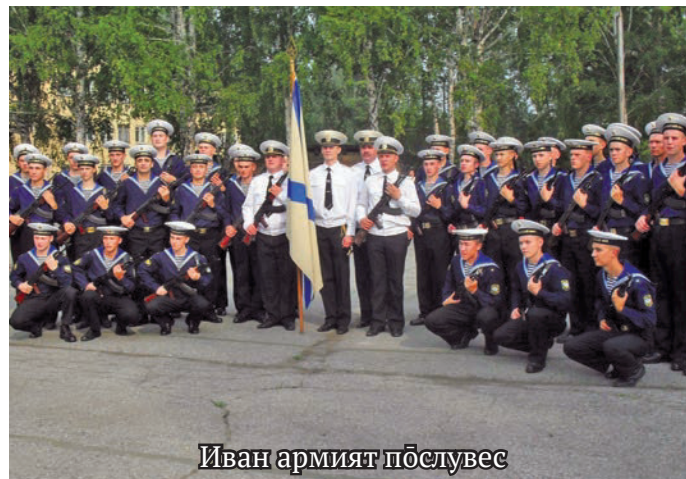
Иван армият пöслүвес

тыт, нилыт, хōтыт ос нёлоловит бригадат махум рүпитэгыт.