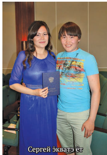
Сергей экватэ ёт