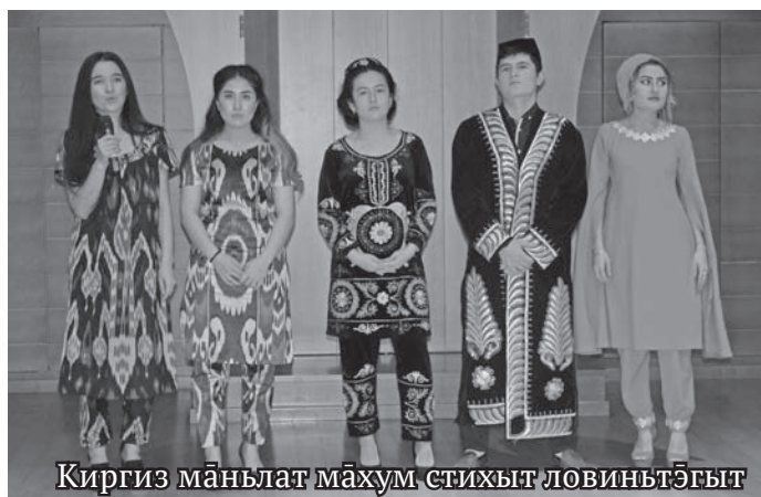
Киргиз маньлат махум стихыт ловиньтэгыт

Т ы этпос 21 хөталэ ЮНЕСКО организациян щань латың хөталыг намайавес. Касың тал ты хөталт ма янытыл олнэ мирыт танти латңыл потыр хансэгыт. Округует олнэ маньщиянув тамле хонтхатыглап ос варыглэгыт. Ман мавт сав мирыт олэгыт, касың такви латңе эруптытэ, мире янытлытэ.