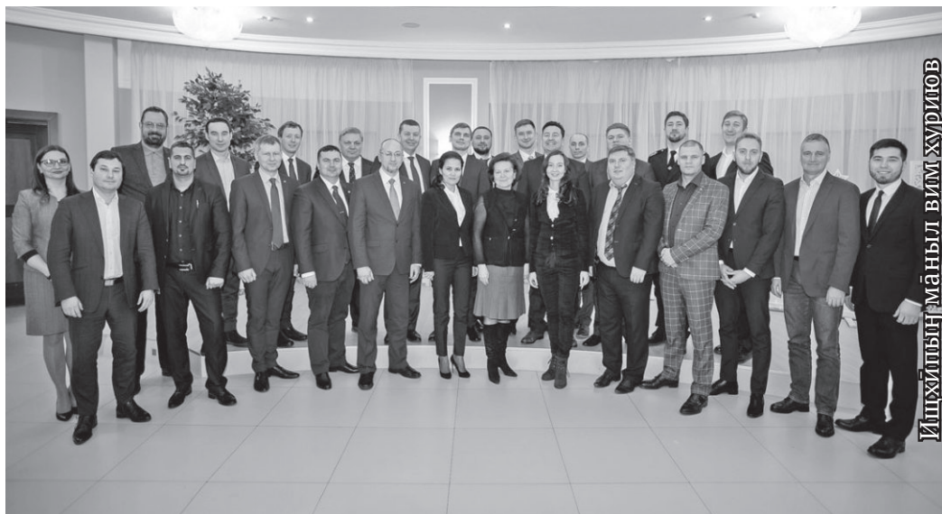
Ишхипың маныл вимхуринов