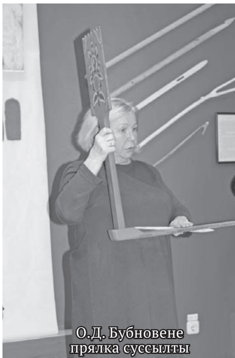
О.Д. Бубновене прялка суссылты